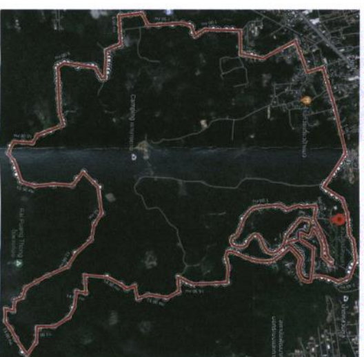
Trail Half Marathon 18 km.