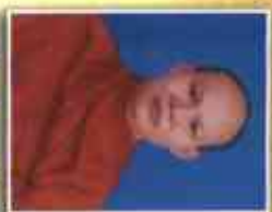
พระอัครวิมล, สิริขันธ์ สังฆคณิสสร