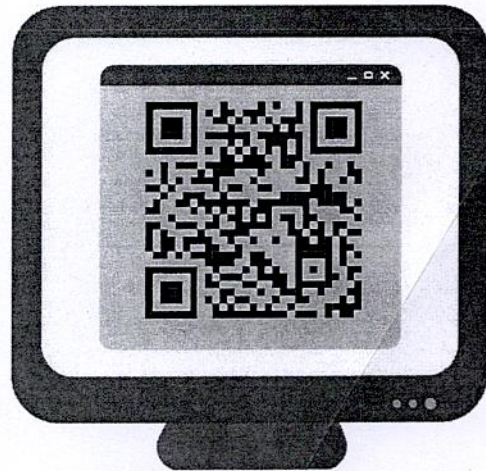
Poster ประชาสัมพันธ์