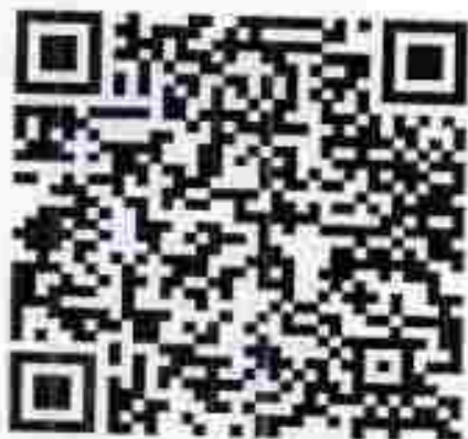
QR Code มีรายละเอียดเพิ่มเติม และการรับสมัคร