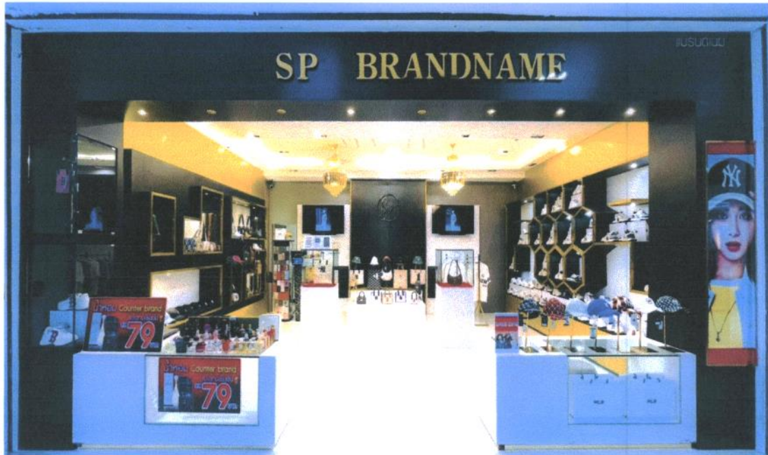
SP BRANDNAME SHOP สาขาโรบินสัน โอเชียน นครศรีธรรมราช