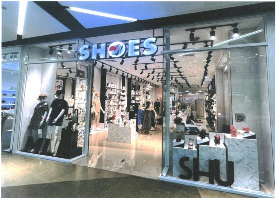
SHOES SHOP สาขาเซ็นทรัลพลาซ่า สุราษฎร์ธานี