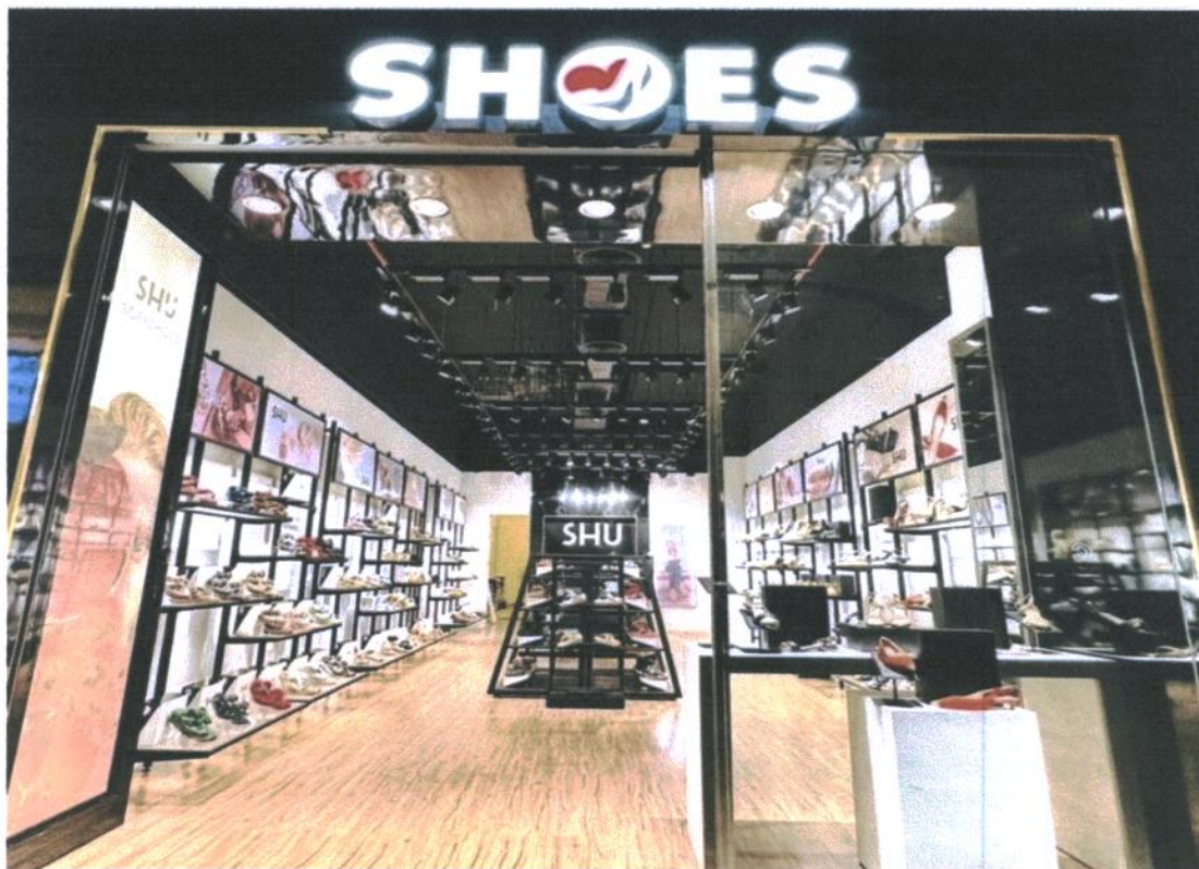
SHOES SHOP สาขาเซ็นทรัลพลาซ่า นครศรีธรรมราช