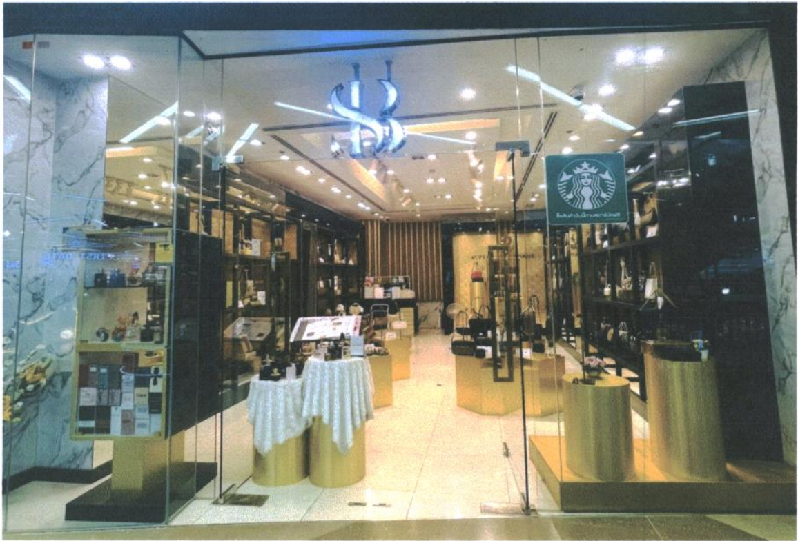
SUPERB BRANDNAME SHOP สาขาเซ็นทรัลพลาซ่า สุราษฎร์ธานี