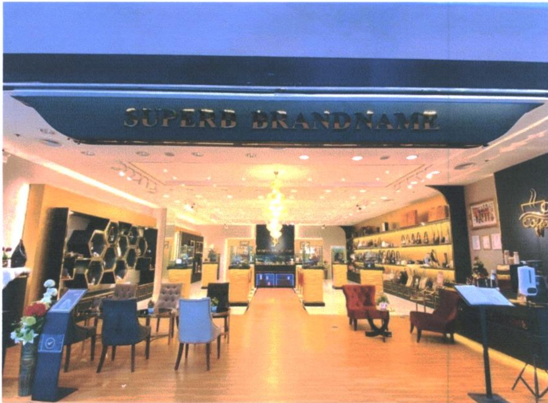
SUPERB BRANDNAME SHOP สาขาเซ็นทรัลพลาซ่า นครศรีธรรมราช