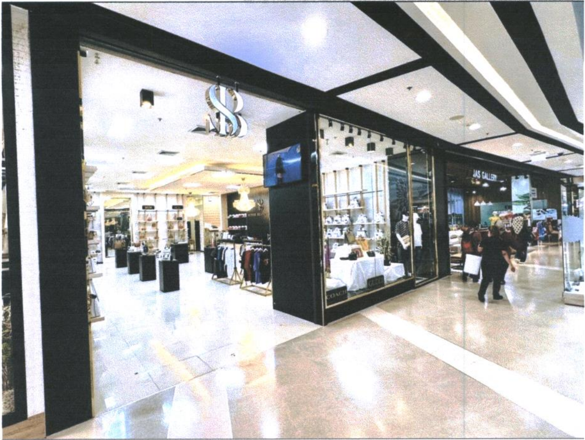
SUPERB BRANDNAME SHOP สาขาเซ็นทรัลเฟสติวัล หาดใหญ่