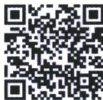
แบบเสนอชื่อ

ให้ผู้ปฏิบัติงานในมหาวิทยาลัยสังกัดฝ่ายนิติการ สำนักงานมหาวิทยาลัย เสนอชื่อผู้มีคุณสมบัติเหมาะสม เพื่อเข้ารับการสรรหาเพื่อดำรงตำแหน่งหัวหน้าฝ่ายนิติการ สำนักงานมหาวิทยาลัย คนละไม่เกิน ๑ ชื่อ ผ่าน Google Forms โดยสแกน QR Code ด้านล่างนี้ ภายในวันที่ ๓๑ พฤษภาคม ๒๕๖๗ ทั้งนี้ เลขาธิการคณะกรรมการสรรหาหัวหน้าฝ่ายนิติการ สำนักงานมหาวิทยาลัย จะแจ้งให้ผู้ได้รับการเสนอชื่อกรอกแบบแสดงเจตนาเข้าร่วมในกระบวนการสรรหา ผ่าน Google Forms โดยสแกน QR Code ด้านล่างนี้ ภายในวันที่ ๗ มิถุนายน ๒๕๖๗