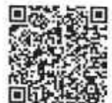
QR Code แบบคำร้องขอโอน

หรือ https://www.dot.go.th/form-download/departement-downloadFileDetail/49/file1