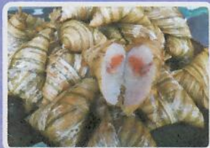
ต้มสามเหลี่ยมไสไส้