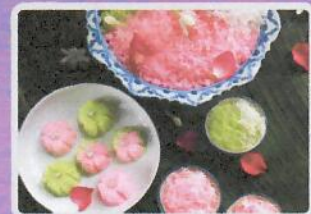
ขนมขี้หนู

สามารถร่วมโหวตได้ตั้งแต่บัดนี้ - ๙ สิงหาคม ๒๕๖๗ (ปิดโหวตวันที่ ๙ สิงหาคม ๒๕๖๗ เวลา ๑๖.๓๐ น.)