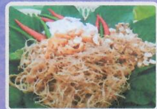
ย่าสาทรายพมนาง