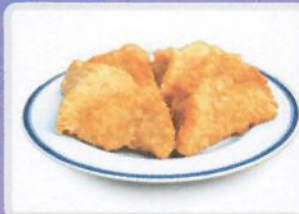
ขนมค้างคาว