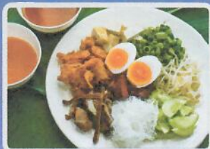
เต้าคั่ว

ภายใต้โครงการส่งเสริมและพัฒนาระดับอาหารถิ่นสู่มรดกทางวัฒนธรรม และอัตลักษณ์ความเป็นไทย ประจำปี พ.ศ. ๒๕๖๗ (Thailand Best Local Food)