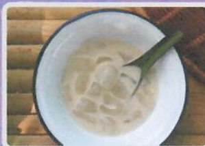
ลูกตาลกะทิสด