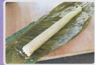
ข้าวหลามซึกพรุด