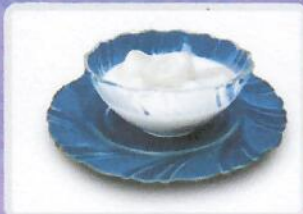
ขนมหัวล้าน