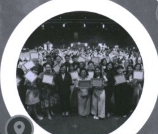
พร้อมรางวัลเรียนดี งานคืนสู่เหย้านิติพัฒน์