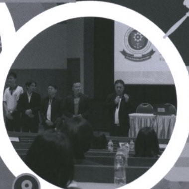
พบปะสมาคมศิษย์เก่า และคำแนะนำในการเรียนจากรุ่นพี่