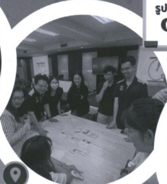
กิจกรรมในชั้นเรียน การเล่นเกมส์ กับปัญหากฎหมายร่วมสมัย