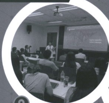
บรรยายพิเศษจากผู้ทรงคุณวุฒิ ที่เกี่ยวข้องในสายวิชาชีพ