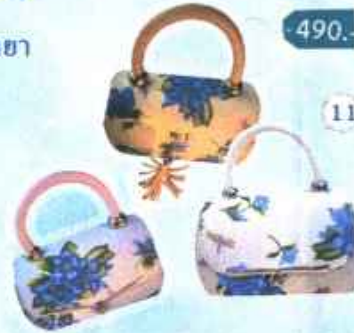
11. กระเป๋าถือลายดอกแก้วกัลยา (สีม่วง, สีครีม, สีเหลือง)