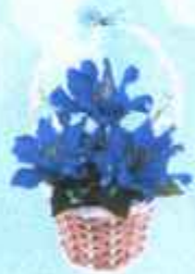
1. ดอกแก้วกัลยา (แบบเดี่ยว)