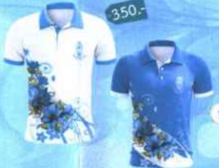
7. เสื้อยืดคอปกลายดอกแก้วกัลยา (แบบสกรีน Transfer)