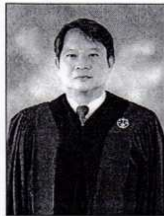
๒. นายตระหง่าน เกียรติศิริโรจน์ อธิบดีศาลปกครองชั้นต้น